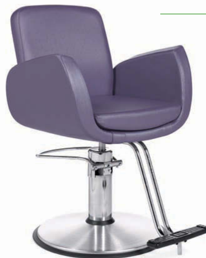
B2810 EI54 Eli - Plum (CF Stinson) Vinyle Eli en prune (CF Stinson) EI54