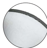
Brushed Chrome Chrome brossé